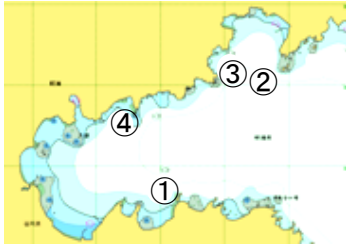
図 調査点(鮫ノ浦湾)