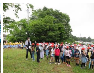
（大谷小学校での取組の様子）