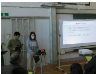
（館矢間小学校での取組の様子）