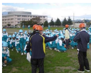
（青葉中学校での取組の様子）