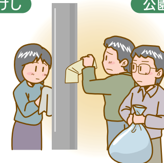
違反広告物の取りのぞき