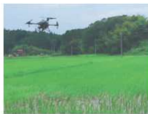
7/10 ドローン による追肥