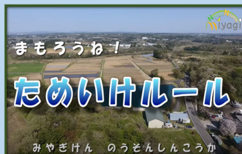
▲ためいけルールの動画

宮城県では、注意喚起のリーフレットや動画を作成しています。皆様の安全のためにも、 ため池や用水路等には近寄らないようお願いします。