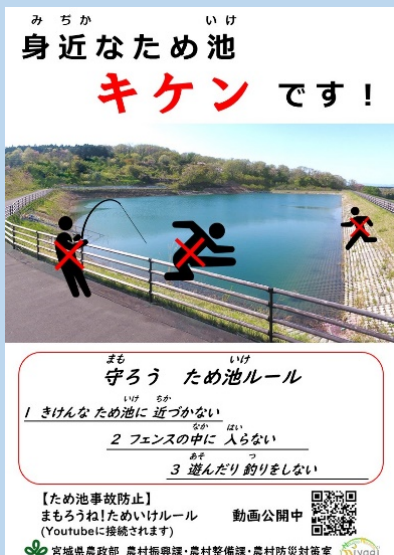
▲注意喚起リーフレット

宮城県では、注意喚起のリーフレットや動画を作成しています。皆様の安全のためにも、 ため池や用水路等には近寄らないようお願いします。