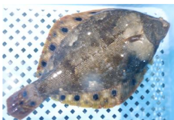
気仙沼魚市場に水揚げされた ホシガレイ

少し前までは「幻の魚」と言われていたホシガレイですが、漁業者の方々の地道な取組により、近年では頻りに魚市場に水揚げされるようになりました。稚魚の放流は7月頃を予定しています。