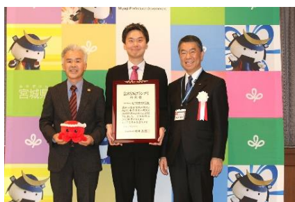
富県宮城グランプリ授賞式

なお、将来的には同賞のグランプリ受賞を目指してもらえよう、当事務所としても継続した支援を行ってまいります。