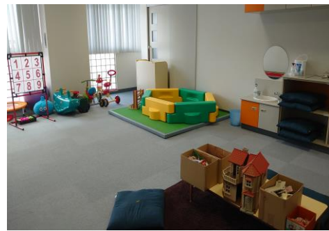
お子さんのプレイルームもあります