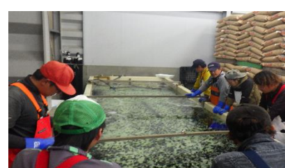
研究会員による稚魚飼育