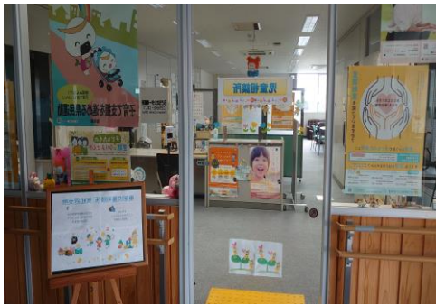
保健福祉事務所のとなりです