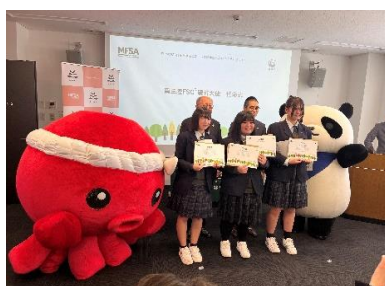
南三陸 FSC 親善大使任命