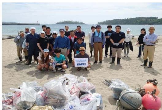
清掃とゴミの分別