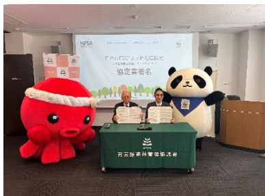
2者による協定締結

※FSCとは：責任ある森林管理を世界に広めることを目的とする国際的な非営利団体が、持続可能で且つ、適切な森林管理を広めるための国際的な森林認証制度。