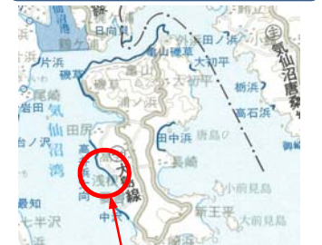
高井浜大向地先海岸