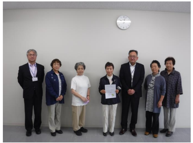
なでしこ会の皆さんと