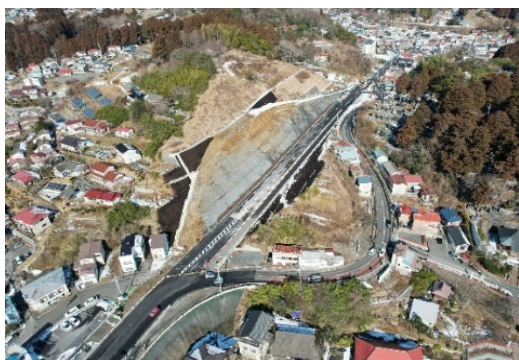
令和5年2月 暫定供用 開始