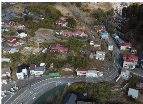
令和元年11月 道路改良工事 着手