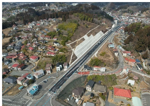
令和8年3月 道路改良工事 完了