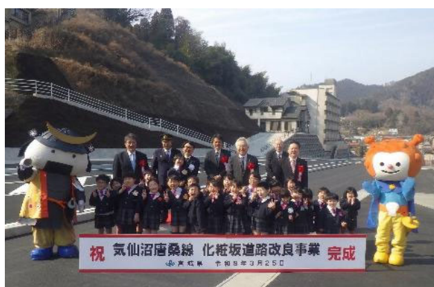
地域の担い手(葦の芽幼稚園児)との記念撮影