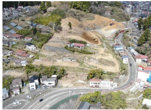
令和3年3月 掘削工事 開始