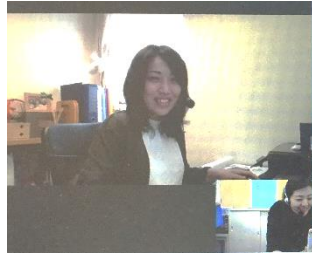
テレワークの様子