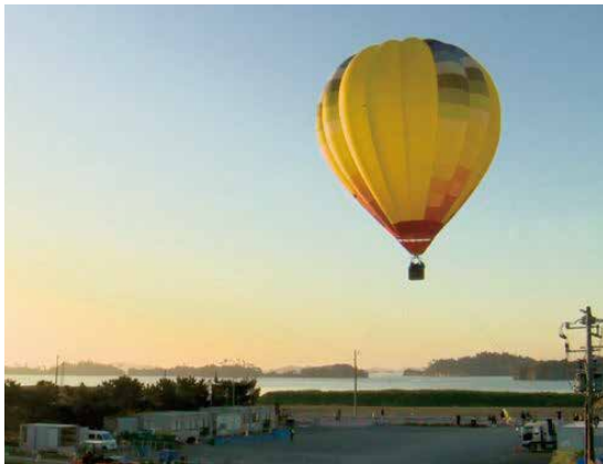
発射場:磯崎漁港 磯島