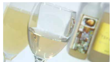
長十郎の梨を使ったワイン。