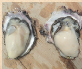
未産卵の小さな「あまころ牡蠣」