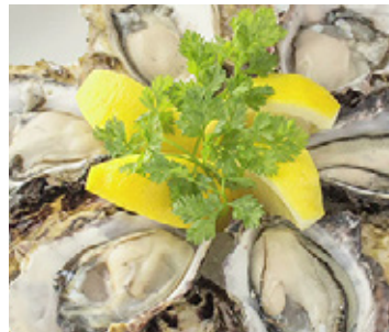
県内でもあまり出回らない希少なあまころ牡蠣。