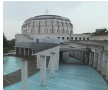
アンフィシアター