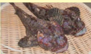
ボッケ(ケムシカジカ)