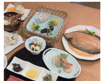
ナメタガレイの煮付け