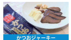
かつおジャーキー