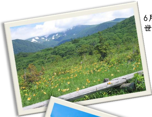
6月下旬 世界谷地原生花園