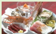
刺身の盛り合わせ