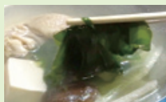
わかめのしゃぶしゃぶ