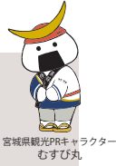
宮城県観光PRキャラクター むすび丸

伊達な旅紀行 いいトコ! みやぎ 毎週月曜日 よる7時54分 BS-TBSにて大好評放送中