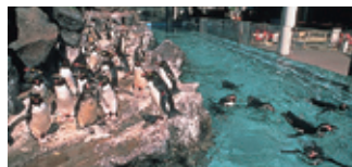
マリニピア松島水族館