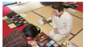
円通院の数珠作り

好きな珠を選んでオリジナルの数珠を作る円通院の体験のほか、瑞巖寺で毎週木曜に体験できる写経などが人気。長い歴史を持つマリニピア松島水族館では、アシカの握手など体験型のイベントも行われています。また、ベルギーオルゴールミュージアムでは、手作りオルゴール体験も。ライトアップを楽しんだ後は、体験で思い出を作ってみてはいかがでしょうか。