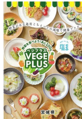
▲ベジプラスレシピ