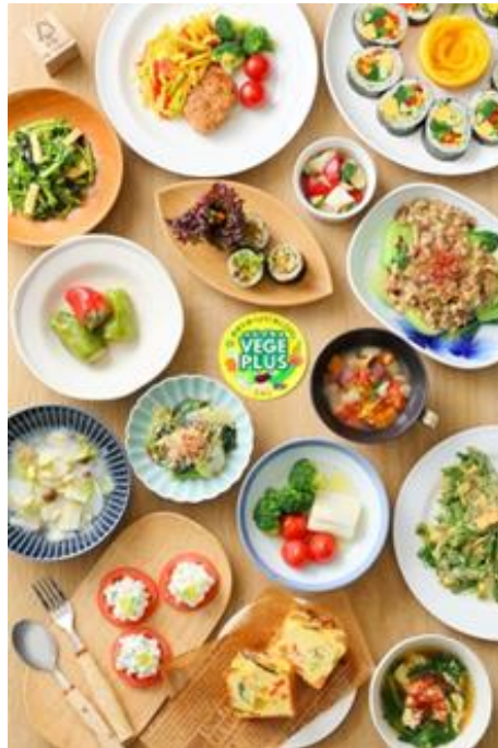
▲みやぎベジプラスレシピ