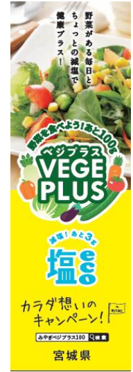
▲ベジプラスのぼり ・ミニのぼり