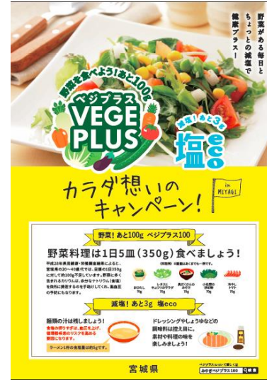
▲ポスター (B2, B3)