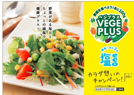
▲A5 チラシ, B6 レシピカード