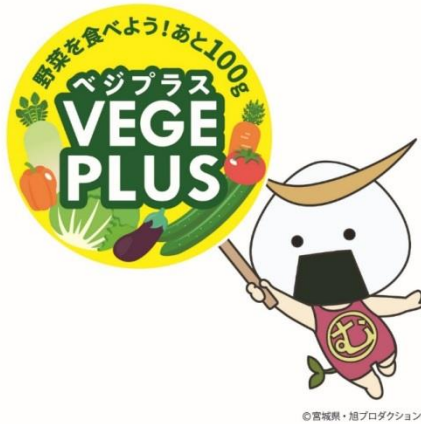
▲ベジプラスver むすび丸ロゴ