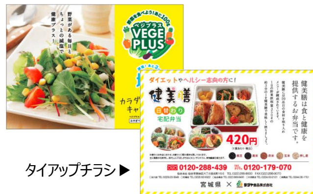
タイアップチラシ▶

野菜の多いヘルシーメニュー「健美膳」と一緒にタイアップチラシを配布していただきました。