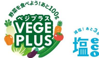
▲ベジプラス・塩ecoロゴ