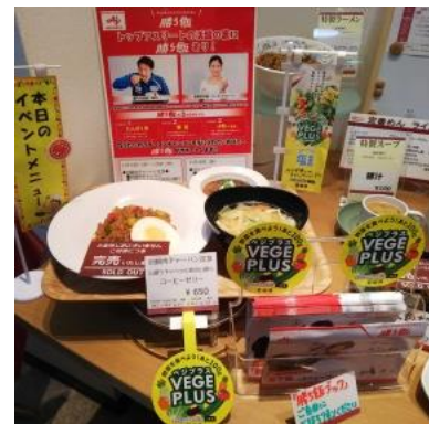
▲勝ち飯！回鍋肉チャーハン定食