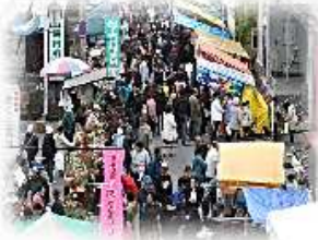
鹿島台地域 春の互市