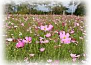
松山地域 コスモス園