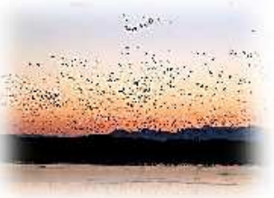
田尻地域 野鳥の楽園「燕栗沼」