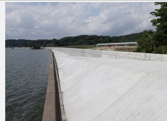
東松島市側より松島町側を望む。