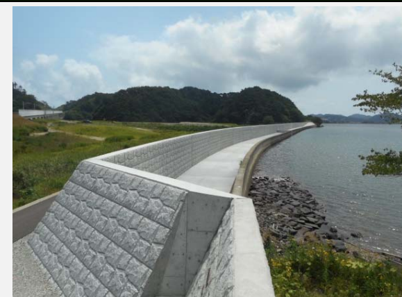
松島町側より東松島側を望む。