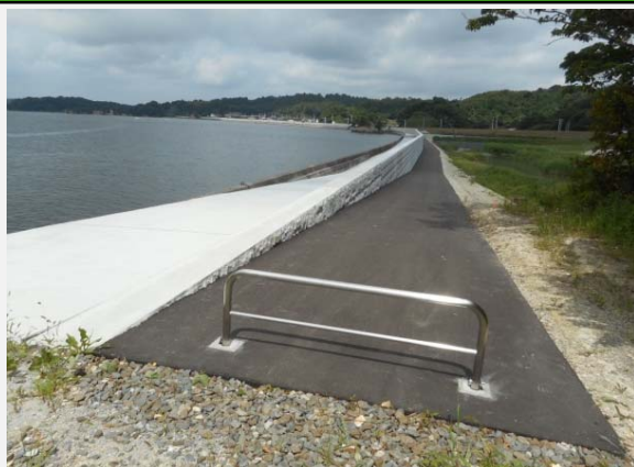
東松島市側より松島町側を望む。