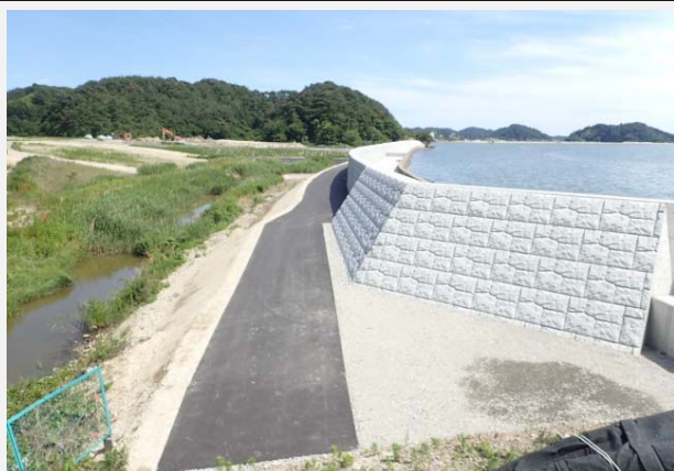
松島町側より東松島側を望む。