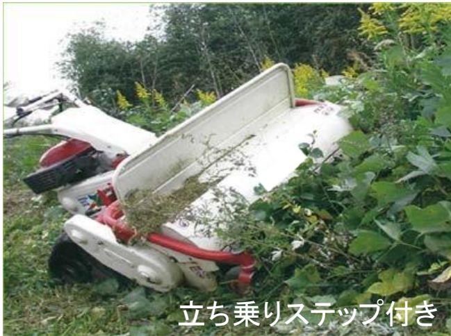
立ち乗りステップ付き