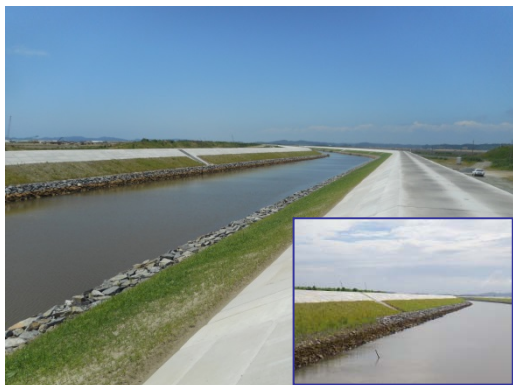
寄石・覆土状況(北上運河)