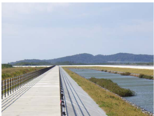
ヨシ生息状況(北上運河)