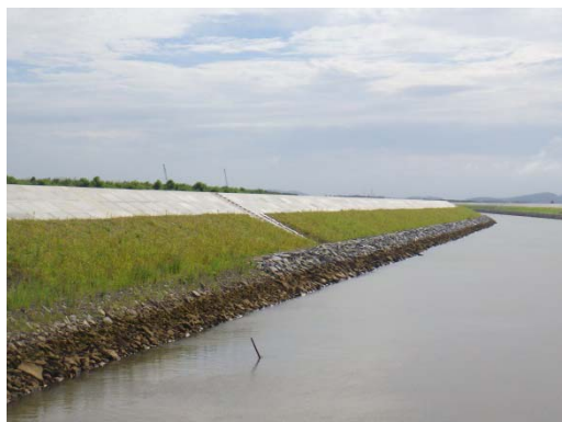
寄石・覆土状況(北上運河)