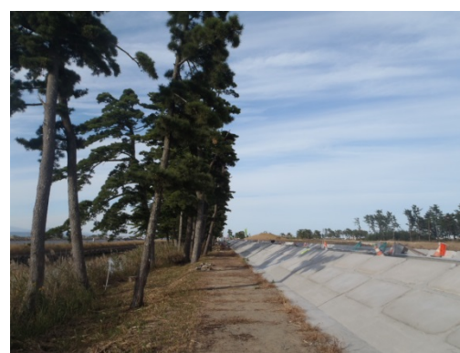
松並木の保全状況