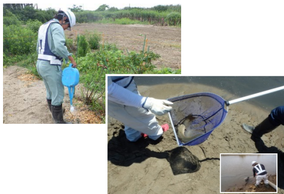
植物の移植・移動生物放流状況(南北上運河)