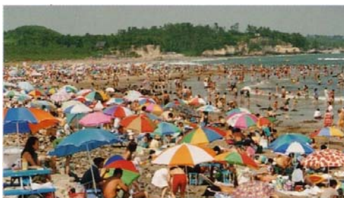
写真-5.1 海水浴場として利用

特別名勝松島や松川浦を始めとする景勝地となっている自然豊かな海岸については、維持または再生を図ると共に観光資源としての活用を考えた整備、管理を行っていく。