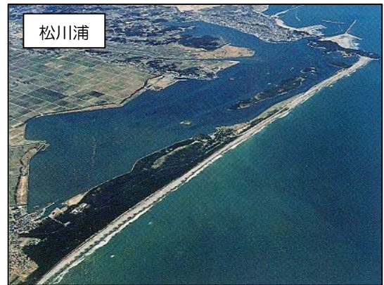
写真-5.3 貴重な自然環境を有する干潟・潟湖