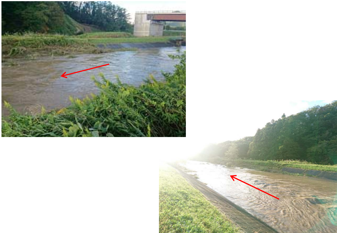
一ノ関水位観測所 (10月13日 7:00) 水位:1.95m 流量:36.29m3/s