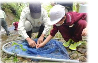
環境教育出前講座