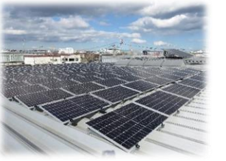
事業者への二酸化炭素排出削減支援