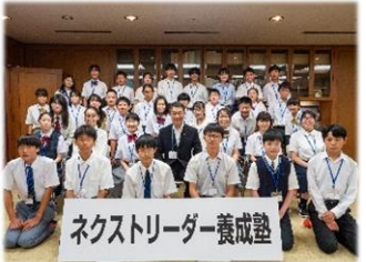
ネクストリーダー養成塾