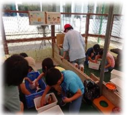
動物愛護センターふれあい教室