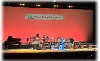
NPO等による心の復興支援事業（ジュニアジャズミーティング inみやぎ2023）