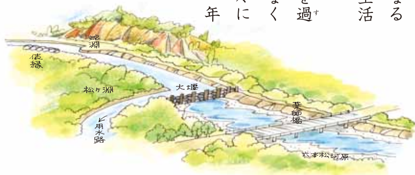
工事前の蔵本村大堰と用水路