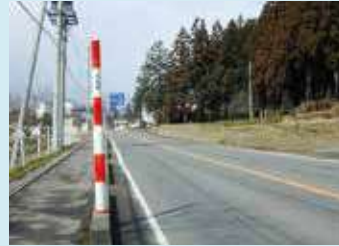
リサイクルスノーポール (視線誘導標)

初回認定：平成 16 年 10 月 1 日 認定有効期限：令和 7 年 9 月 30 日 実販売価格：— 販売時の仕様：工場(店頭)渡し、現場渡し 適合規格(JIS等)：— 実績：—