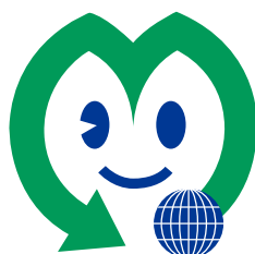
宮城県グリーン製品