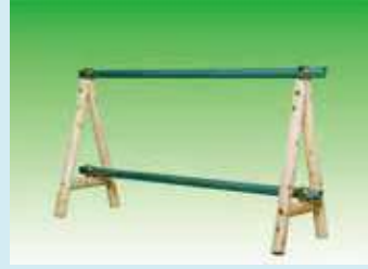
間伐バリケードスタンド (木製単管バリケード用脚)

初回認定：平成 19 年 10 月 1 日 認定有効期限：令和 7 年 9 月 30 日 実販売価格：— 販売時の仕様：工場(店頭)渡し、現場渡し 適合規格(JIS等)：— 実績：—