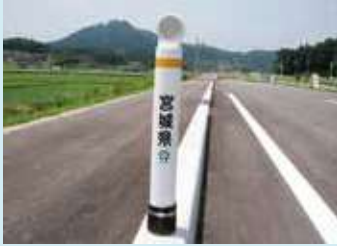
リサイクルデリニエーター (視線誘導標)

支柱部は、自社旧製品を回収し、リサイクル工程を経て再生品化したデリニエーターです。