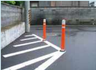
リサイクルセーフティポスト (視線誘導標)

初回認定：平成 16 年 10 月 1 日 認定有効期限：令和 7 年 9 月 30 日 実販売価格：— 販売時の仕様：工場(店頭)渡し、現場渡し 適合規格(JIS等)：— 実績：—