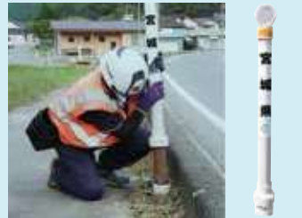
差込式木製デリニエーター (視線誘導標)

初回認定：平成 19 年 10 月 1 日 認定有効期限：令和 7 年 9 月 30 日 実販売価格：— 販売時の仕様：工場(店頭)渡し、現場渡し 適合規格(JIS等)：— 実績：—