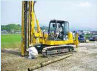
環境パイル (地盤補強材)

国産木材に高品質な防腐防蟻処理を施し、「腐食しない」「蟻害しない」60年相当の耐久性認証を取得した地盤補強材です。