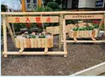
看バリ君 (工事名表示看板)

宮城県産間伐材を使用した地球に優しいエコな工事用バリケードです。宮城県土木工事共通仕様書品質管理基準及び宮城県農業土木工事共通仕様書に適合しています。(プレート、プランター、鉢植え県産花は含まれておりません。画像はオプションを追加した場合の写真となります。)