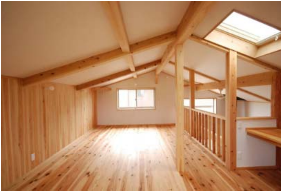
ロフトのような2階には、まだ間仕切りがありません。子供たちの成長に合わせて変化していきます。