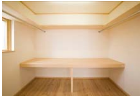
収納の他にたっぷり収納できる3帖タイプのウォークインクローゼット。 これで部屋はいつもスッキリ!!

ライフスタイルは人それぞれ。どんな暮らしをしたかによって大きくイメージは変わります。それらを一つにまとめ上げ、造り上げていく為には、お施主様のご予算、ご要望やお考えをしっかりと伺った上で、お打ち合わせをさせていただき事を重視しています。個々の生活を尊重した使い勝手のよい家づくりには、お客様との打ち合わせの積み重ねが欠かせません。