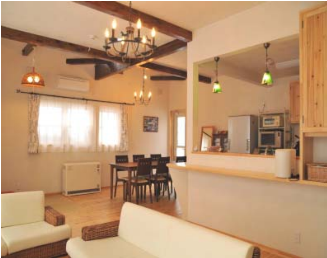
『ゆったりした、リビングダイニングキッチン』 家族の団欒のメインルームです。