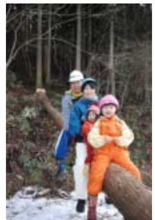
仙台市・Kさん 木のぬくもりにあこがれ、山の恵みを体験する中で決めた我が家。これから家族5人が大黒柱とのびのびと歩んでいくのが楽しみです。

まるで有機野菜のようなやさしさと ちつちやくても、のびのびできる家 住まいの風工房