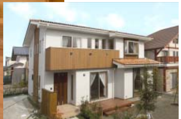
白を基調に、アクセントとして木目調の素材を使い、すっきりとした印象に仕上げました。

自然素材を活用した自分らしい こだわりの家づくりを提案します 有限会社 クマガイ建工