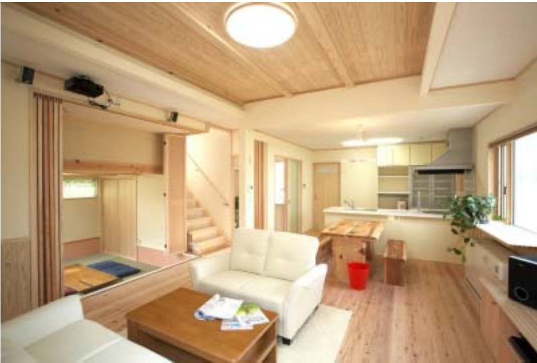
開放感たっぷりのLDK ホームシアターも常設。家族が自然と集まるスペース