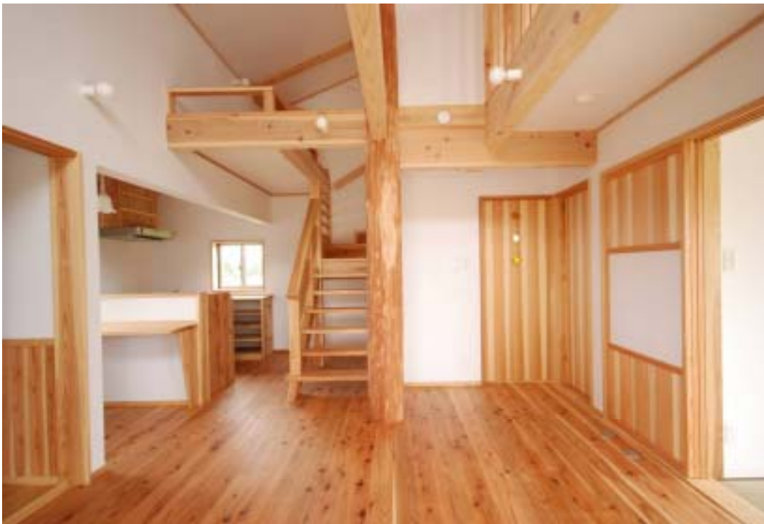
家族みんなで雪山へ行き、伐採した大黒柱が力強く支えています。これらかはいつも、ずっと一緒です。

風工房は、自然の恵みを享受し、お返し、そして住む人の心やからだや絆を育む家づくりをしています。それは自然に囲まれた数百坪の家でも、大都会の真ん中の20坪の家でも、同じことです。環境と共存して、人も一緒に成長できる家。私たちはそんな家をつくっています。