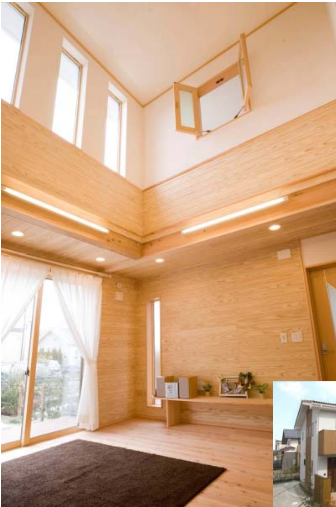
高い天井と高窓からの光がそそぎ、開放的でくつろぎの空間。

自然素材を活用した自分らしい こだわりの家づくりを提案します 有限会社 クマガイ建工