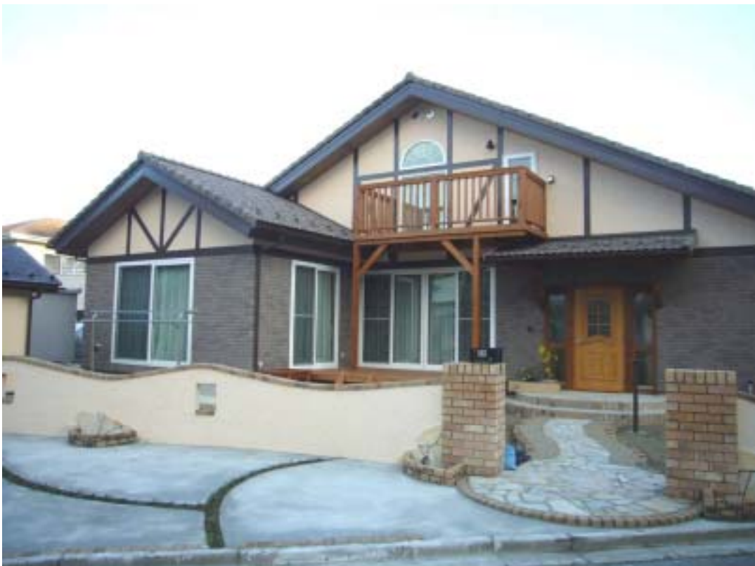
仙台市・N邸 変形な敷地を有効に活用したエクステリアです。