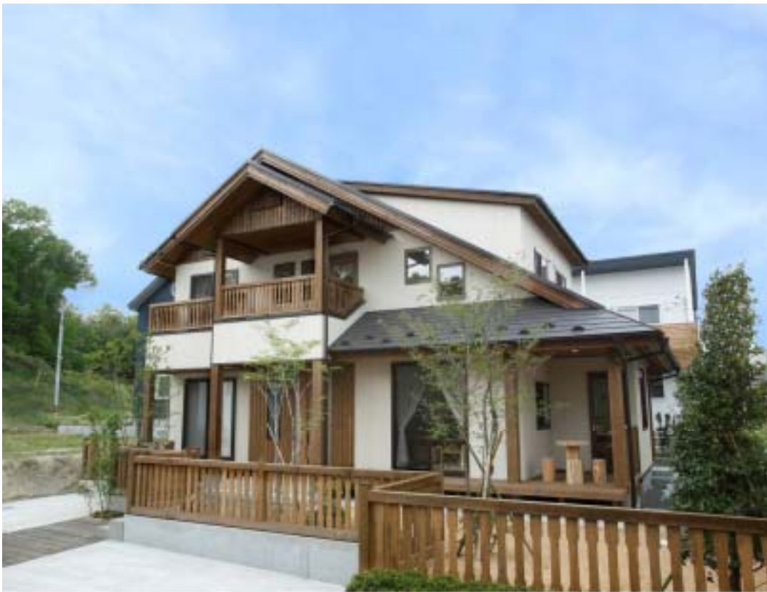
木材をふんだんに使った、近代レトロな雰囲気の外観

師匠から弟子へと受け継がれてきた伝統ある「技」を基本ベースに、創業時より一貫して在来工法を守り続けています。