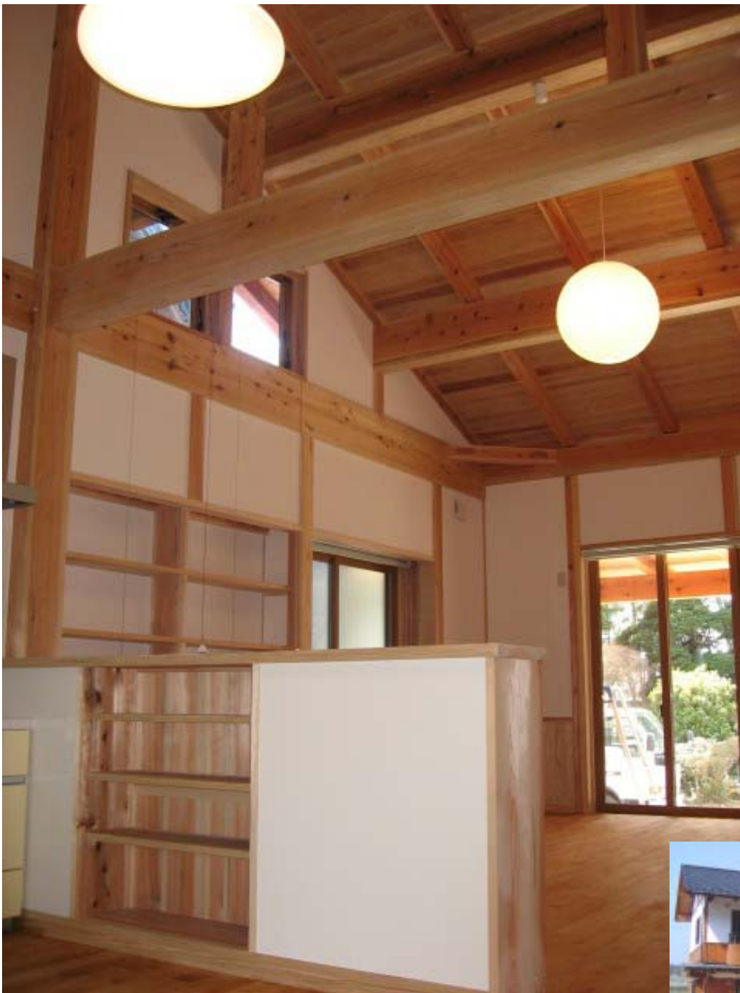
天井を野地板現しにし大空間を実現。