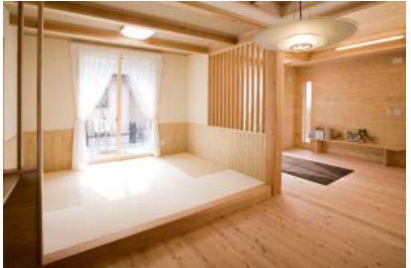
小上りタイプの和室と結びつけば、ホームパーティも可能。