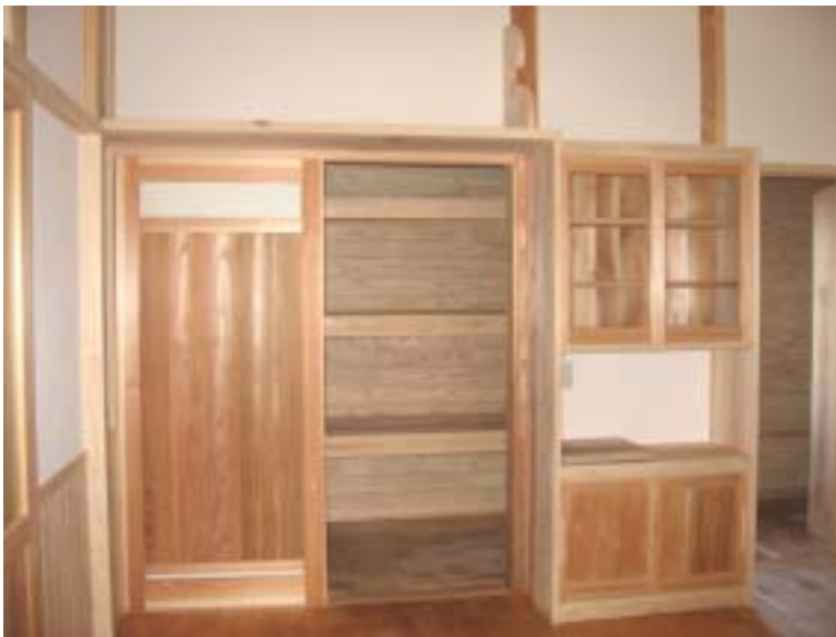
建具、家具を自社で加工し木のぬくもりを感じていただけます。

一番に大切にしているのがお客様とよく話し合うこと。 分からない事は聞いてもらえるよう心がけ、お客様の考え、イメージ、こだわりを徹底してお聞きいたします。 そこから、できる事、できない事、もっとこうしたらよいのでは？やデザイン、使い勝手などをプロとして提案しお客様のイメージを具体的に、住んで良かったと言って頂けるような家づくりを進めるよう努めています。