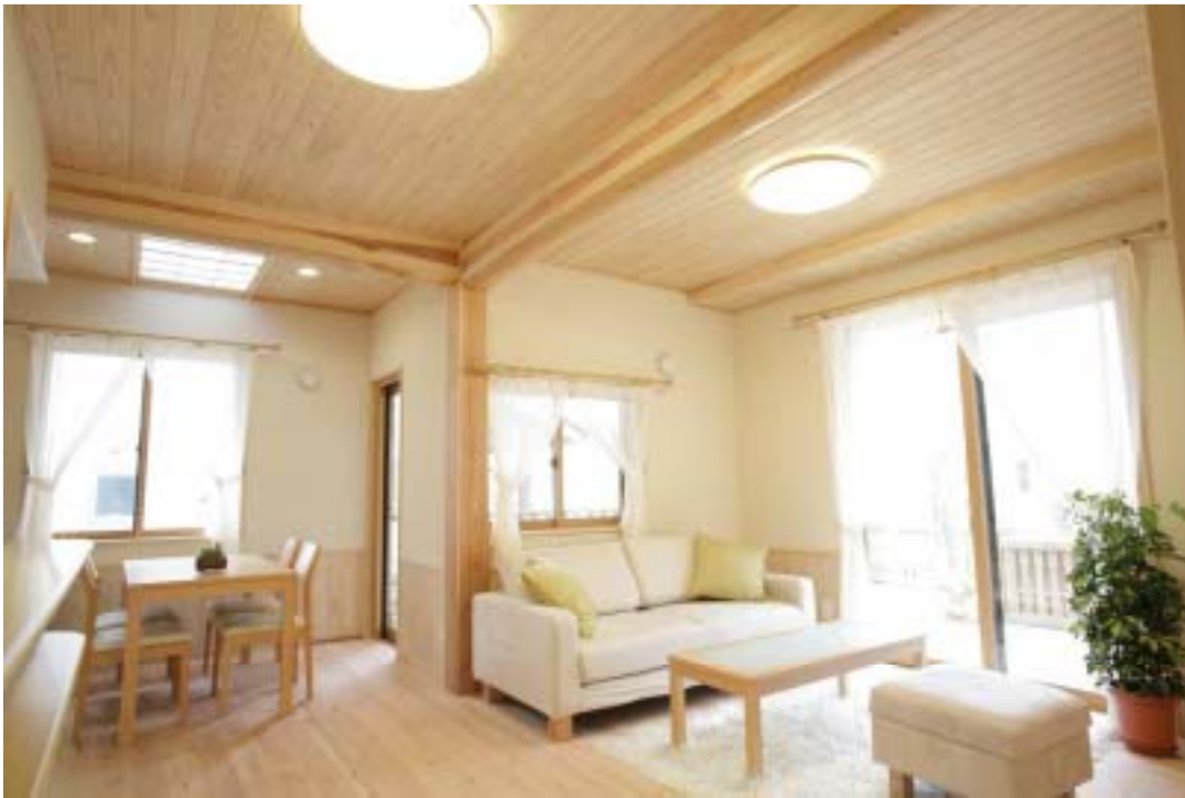
明るく広々としたリビングは、ナチュラルな色が“ホッ”と落ち着く、家族皆の集まる場所。