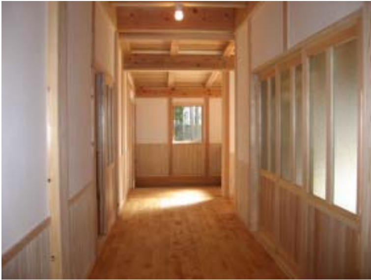
広い玄関ホール。木の温かいぬくもりでお客様をお迎え。