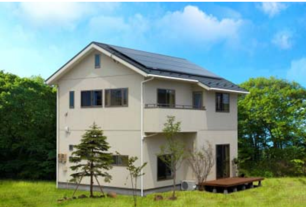
富谷町・O邸 みやぎの木に包まれた癒しと遊び心をくすぐる家

地元を中心に長年にわたり実績を積み重ね、おかげさまで今年で創業59年を迎えさせていただきました。 さらなる飛躍を目指し、「みやぎタウンストリート」に参加することでみやぎ版住宅を手掛けさせていただいております。 みやぎ県産材の利用をテーマに伝統的な木造住宅(在来工法・ムク材の適材適所への使用)の良いところと最新の工法(耐震・省エネ・快適設備)を融合させることにより、宮城の気候・風土に合う長持ちし、安心な健康住宅をご提案させていただいております。