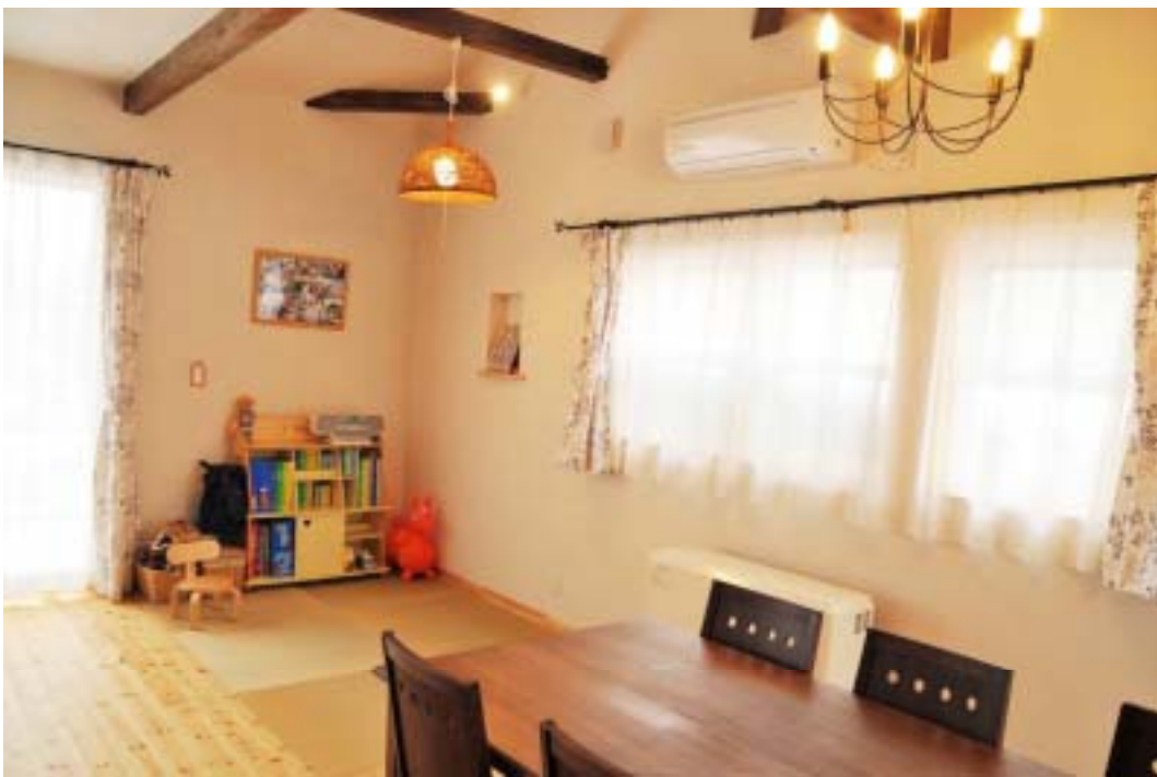
メインルームには、子供の遊び場があります。