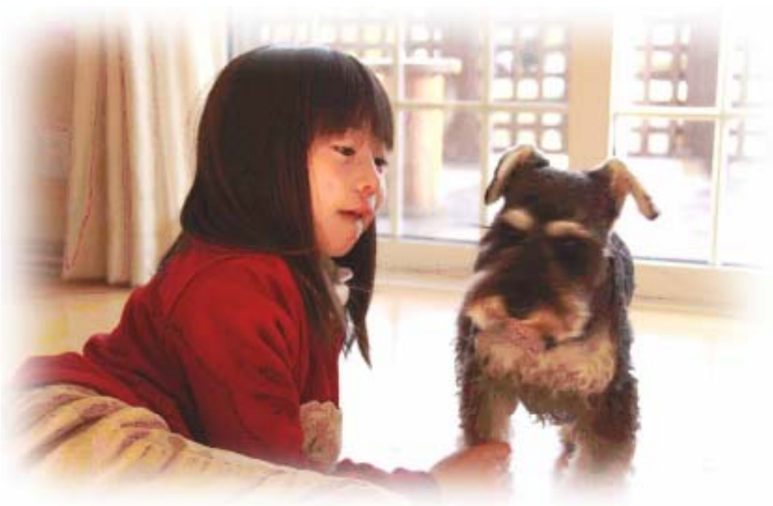
冬 室内どこにいても温度差がない暖かい空間で 愛犬と過ごす様子