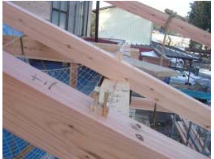
垂木に120角を使用し釘やビスなどで留めるのではなく、ダボ栓と楔で接合しています。