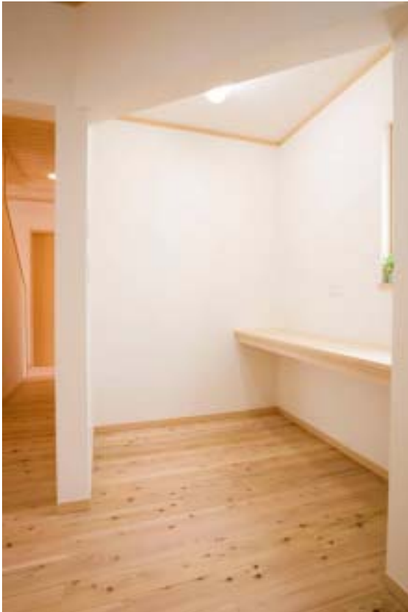
奥様あこがれの趣味を楽しめるマルチスペース。