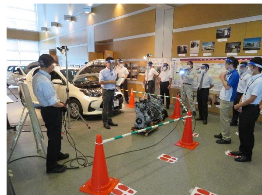
自動車の生産と新技術編