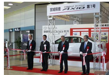
仙台空港での展示の様子 (H23.9.23~H24.5.10)