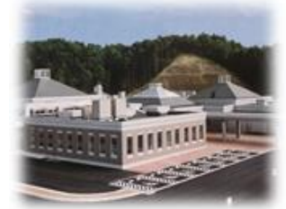
保健福祉センター