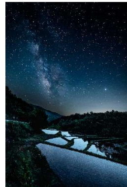
棚田に昇る天の川