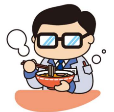
岩沼市マスコットキャラクター

日本三稲荷の竹駒神社や金運・商売のご利益があるといわれている金蛇水神社があり、初詣や例祭など四季折々のイベントが開催されます。