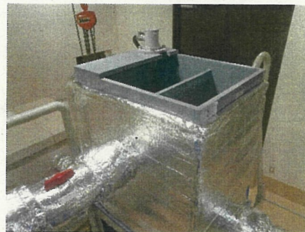
放水口モニタ混合槽(2号機)