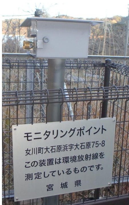
各測定地点に設置