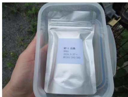
封入してタッパに入れる