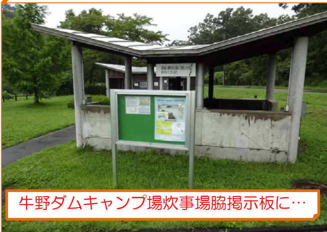
牛野ダムキャンプ場炊事場脇掲示板に…