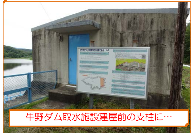
牛野ダム取水施設建屋前の支柱に…