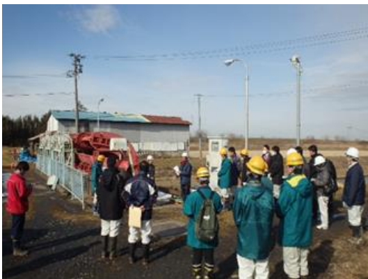
▲工事業者からの工事概要説明状況

緊急補修工事は原則として施設管理者（迫川沿岸土地改良区）が事業主体となりますが、本施設は広域的な排水を担い重要性が高いことから、県営事業で実施しています。