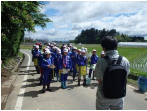
▲田んぼの役割について説明しています