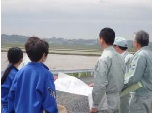
▲農地整備事業実施地域の見学の様子

当事務所において、平成30年5月16日～18日に「平成30年度登米市立佐沼中学校第2学年職場体験学習」が実施され、2名の生徒が来所しました。全体としては3日間の日程でしたが、当部では17日の午前中に体験学習が行われました。当日は参加した生徒から、「道路の整備にはどれだけ時間がかかるのか」、「機場の整備にどの程度の金額がかかるのか」などの質問がされていました。