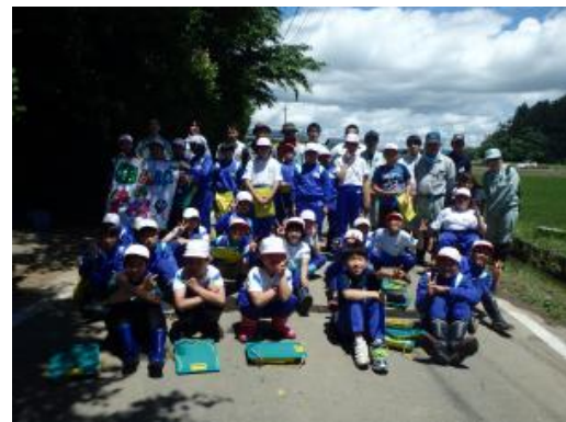
▲恒例の集合写真です