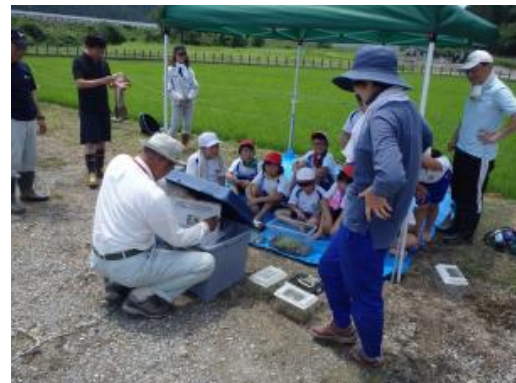
▲生き物の見分け方を勉強しています