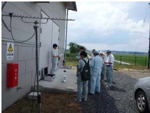
▲注意事項の確認の様子

登米地域事務所では平成28年度にドローンを導入しましたが、新年度になり人事異動で職員が入れ替わったことから、主にドローンの操作経験の無い職員を対象として、ドローンの操作研修を行いました。農地整備事業「伊豆沼2工区地区」で、ドローンを使用する際の注意事項を確認し、飛行のための準備から実際の操作を体験しました。今後も各種事業の中で有効に活用していきます。