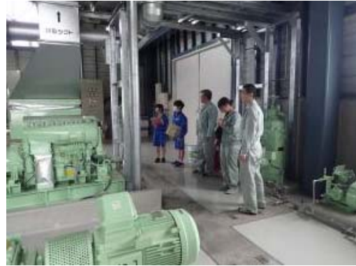
▲排水機場の見学の様子